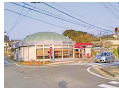
松崎郵便局徒歩約 8 分