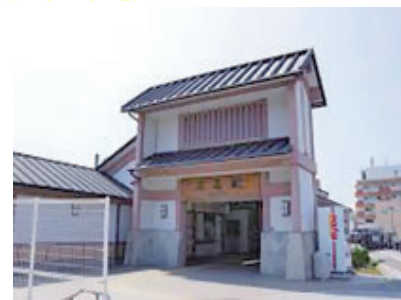
名島駅徒歩約 10 分