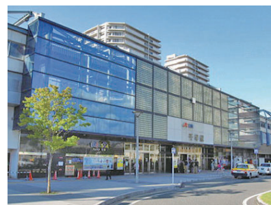
千早駅徒歩約 15 分