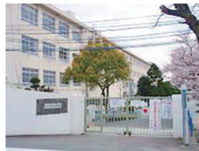
名島小学校徒歩約 4 分

【所在地】福岡市東区松崎4丁目 484-1 【交通】西鉄貝塚線 / 名島駅 徒歩約 10 分 JR 鹿児島本線 / 千早駅 徒歩約 15 分 【土地権利】所有権【地目】雑種地【都市計画】市街化区域 【用途地域】第一種中高層住居専用地域 【建蔽率】60%【容積率】100% 【他の法令】15M高度地区・ガけ条例有 【引渡条件】実測有・現況渡し 【現況】原野（山林）傾斜地【引渡日】即日 【接道状況】東側 4m 間口 6m / 別荘区私道 【設備】上下水道前面道路側まで有り 【備考】開発届必要