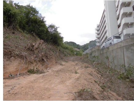
現況写真(2019.09) 伐採済み