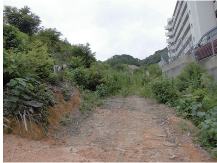
現況写真(2020.09) 雑草あり 伐根 造成工事必要